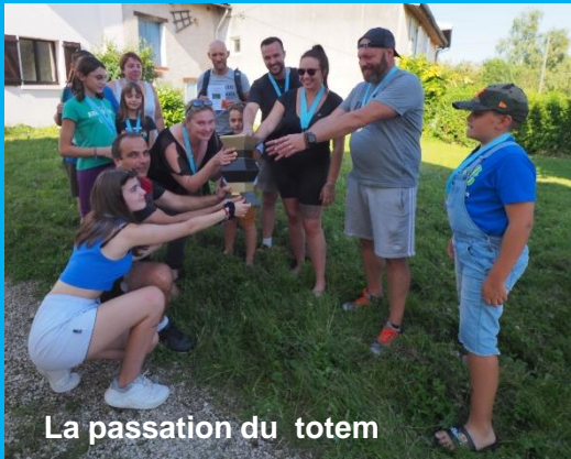
La passation du totem